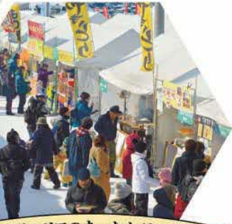
きた北海道エリアのあったかグルメが集う 「冬マルシェ」