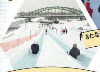
長さ約100mのロング滑り台