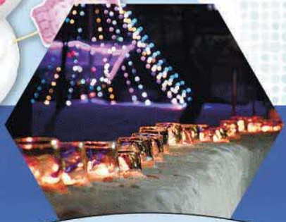
幻想的な雪あかり